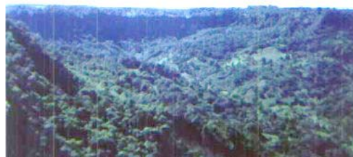
La Sierra Alta.